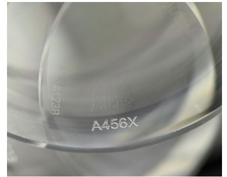
Marquage des étiquettes