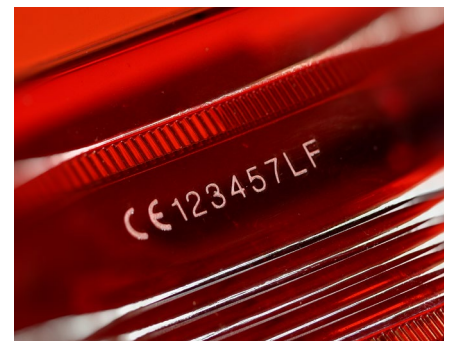
Verre et plastiques transparents