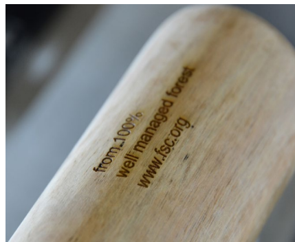
Marquage sur bois